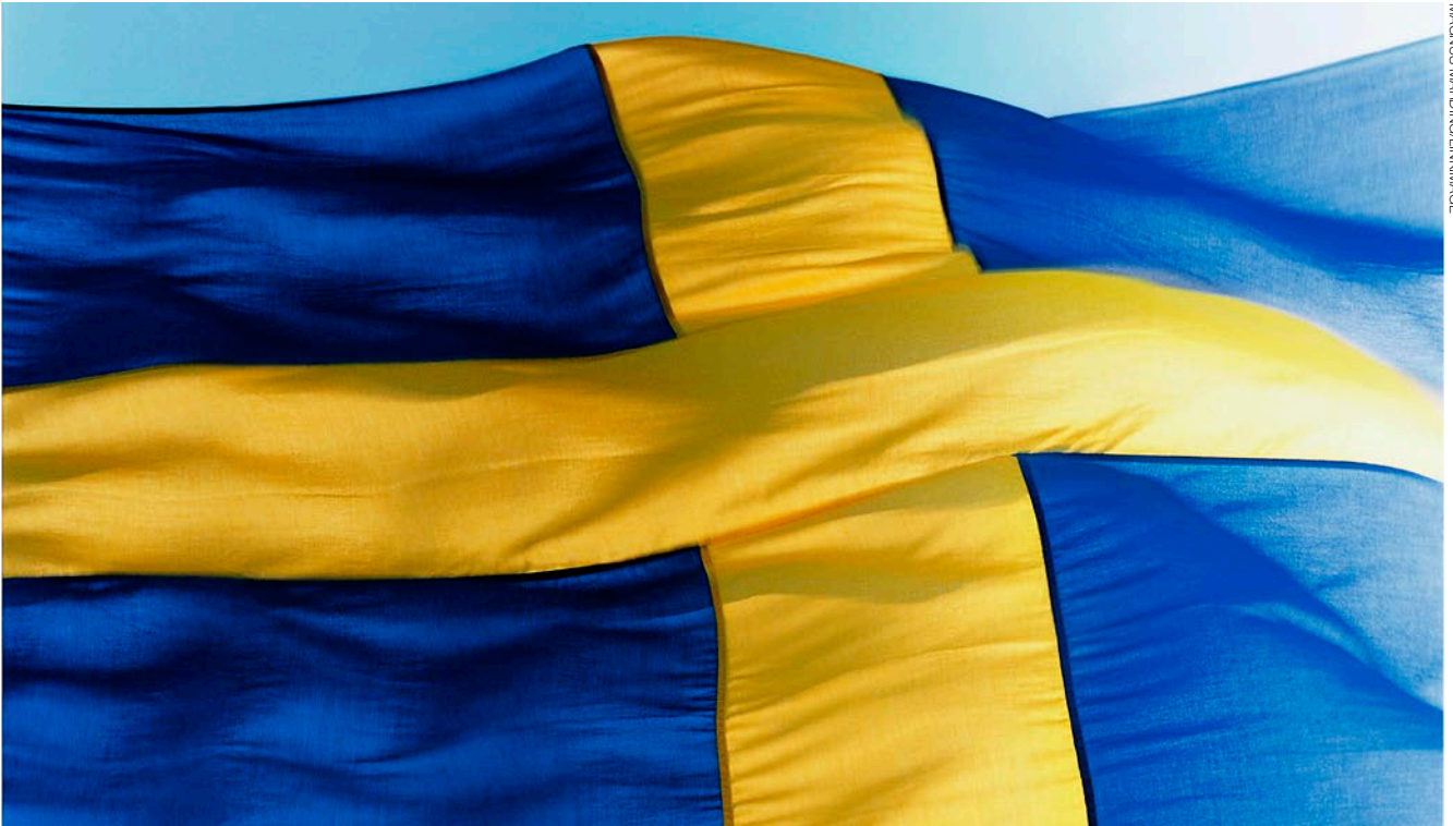
Sveriges flagga, med ett gult kors mot blå bakgrund, finns belagd redan på 1500-talet.