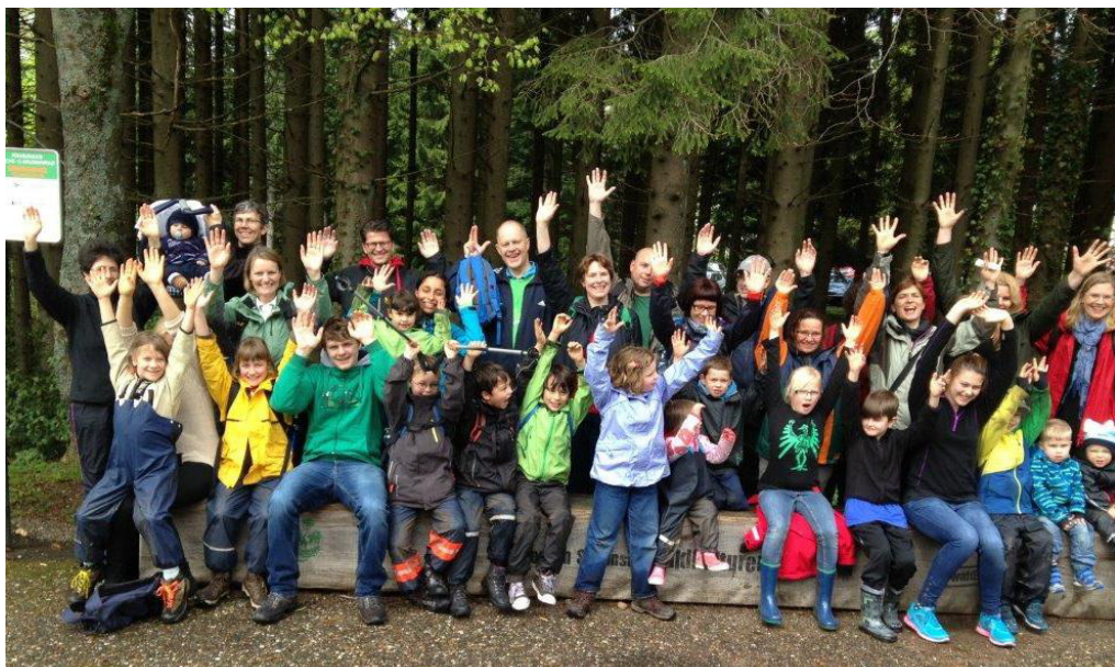
Glada ansikten efter en skön vandring på loddjursstigen/Luchspfad i Plättig/Schwarzwald