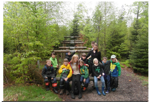
Skolbarnen sitter på en ekorres hopp höjd. Den högsta bjälken demonstrerar ett lodjurs hopp höjd på 2,4 m.