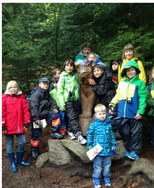
Skolkamrater: Fin gemenskap och höga förväntningar inför vandringen

Följande morgon kom även den andra delen av gruppen till vandrarhemmet som hade rest väldigt tidigt ända hemifrån och vi började dagen med en gemensam frukost och tillberedning av lunchpaket. Först såg vädret inte lovande ut - faktum är att det regnade - men med den goda attityden bland deltagarna att "det inte finns dåligt väder- bara dåliga kläder" gav vi oss iväg till lodjursstigen.