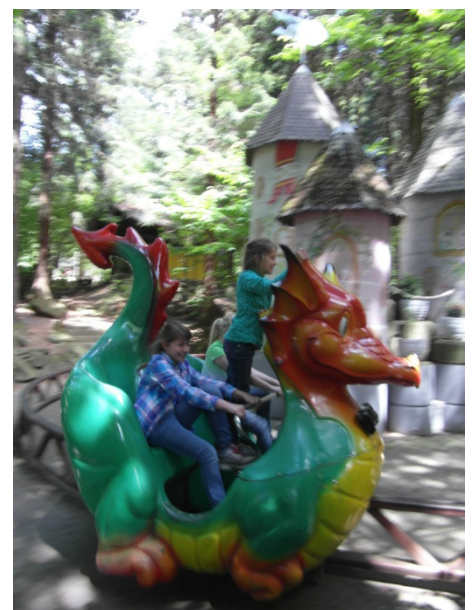
Draktämjare är i farten i Märchenparadies!